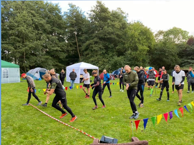
Back Yard Ultra i Anneberg skov

Love Nature Run begik i går et fantastisk Back Yard ultra arrangement. Et helt igennem velgennemført arrangement, hvor selv vejret og vind viste sig fra sin pæne side.